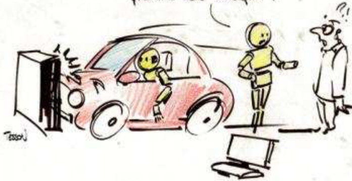
CRASH TEST chez créateurs Techno.

On veut bien participer au PLM mais on réclame une prime de risque !